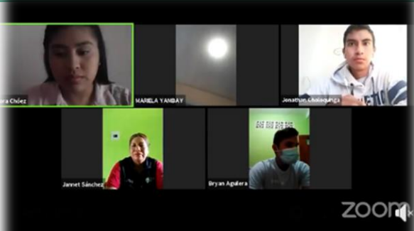
Consejo Consultivo de Jóvenes del Cantón Pedro Carbo ha transmitido en directo. 12 de agosto de 2020