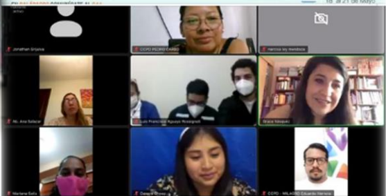
Consejo Nacional para la Igualdad Intergeneracional 21 de mayo de 2020 El #CNII llevó a cabo #DiálogoVirtual para fortalecimiento y análisis de acción de Juntas y Consejos Cantonales de Protección de Derechos en #Guayas, para hacer oportuna su acción frente a la emergencia sanitaria, hacia los grupos de atención prioritaria. #JuntasActivadas